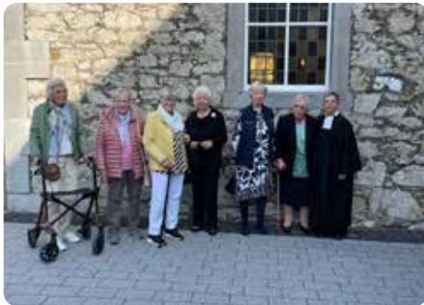
Eiserne Konfirmation (70 Jahre)