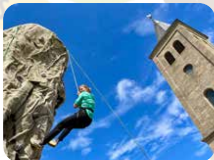
Das Highlight: Der Kletterturm