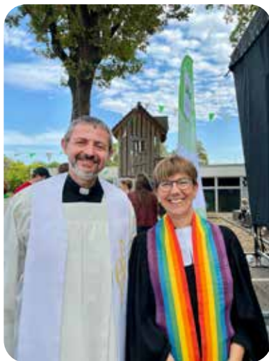
Ökumenischer Gottesdienst zum Blotschenball