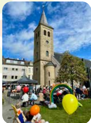
Viele Gäste und strahlendes Wetter