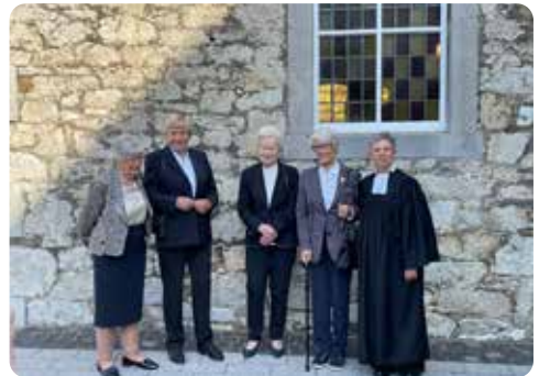
Kronjuwelen Konfirmation (75 Jahre)