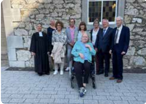
Goldene Konfirmation (50 Jahre)