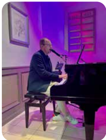
Der Schlager- gottesdienst