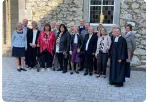
Diamantene Konfirmation (60 Jahre)