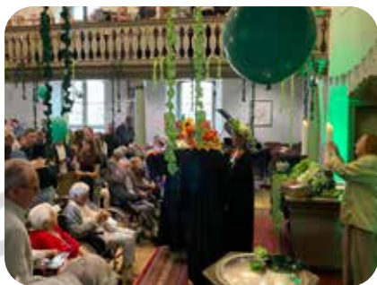
Familiengottesdienst mit unseren Pfarrerrinnen