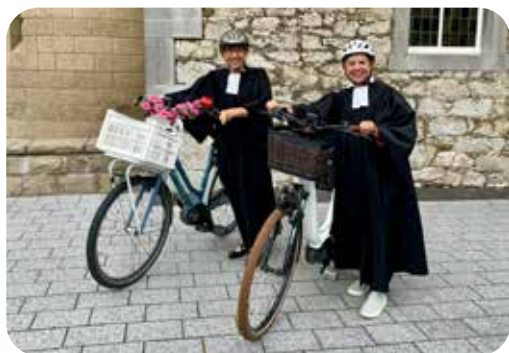
Kirche auf der Trasse