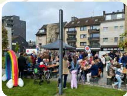
Eine tolle Stimmung