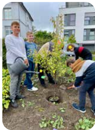
Der Hoffnungsbaum wird gepflanzt