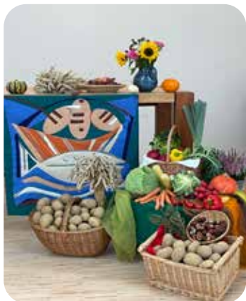
Erntedank in der Dorfkirche