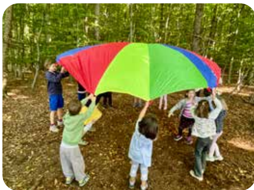
Kindergottesdienst im Wald